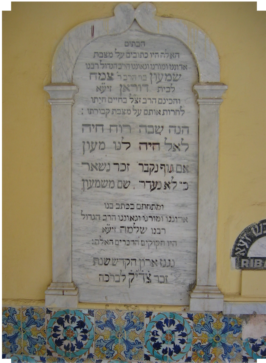
מצבת הרשב"ץ בבית הקברות סנט אוג'ין שבאלג'יר צולם בשנת 2009